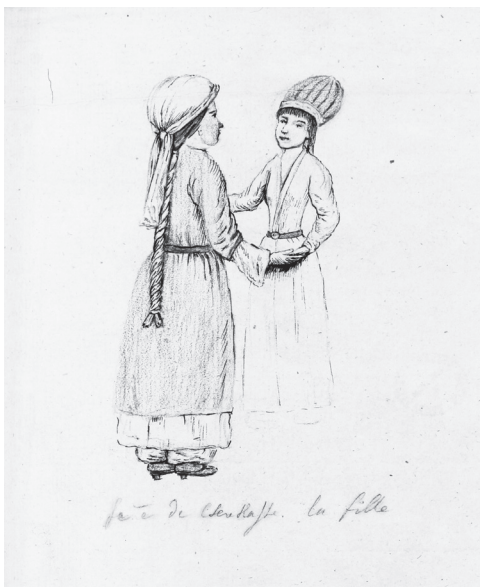
Сл. 5. Сава Текелија, Две женске фигуре (Татарке), 1787.

Међутим, колико га је то зачувило, толико га је још више изненадио један нови аспект Русије који није очекивао ће спознати – феудално ропство. О томе пишу и други путописци, као о једној од карактеристика источне Европе где се услед тешких услова живота сеоско становништво практично налази у ропском положају, што је био само још један доказ о идентичности тог простора с Оријентом (Wolff 1994: 52). Неки од њих су, чак, заступали став да су туга и меланхолија код Руса последице ужасног сиромаштва изазваног неограниченим деспотизмом владајућих и ропским положајем сељаштва (Wolff 1994: 62–63). То је непосредно могао да посведочи и Текелија који је доласком у Тулу (Слика 5), на главном пијачном тргу видео четрдесет девојака изложених на продају: