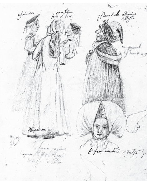
Сл. 4. Сава Текелија, Студија женских ношњи из Русије, 1787.

је представљало стандардни образац на који су наилазили и други путници, попут познатог авантуриста Ђакома Казанове (Wolff 1994: 52). На све то треба додати и генерални однос према сексуалности код Срба тог доба, значајно различит од става које је заузело касније време, што је условило да поготово у овом аспекту Текелија разоткрије драстичне културолошке разлике између „две“ Европе (Тимотијевић 2006: 216–222). Тако је Текелија већ на почетку путовања, на пријему који је организовао његов стриц, имао сусрет с неким девојкама што му је показало да су оквири друштвено прихваћеног понашања источно од Арада били знатно другачији: